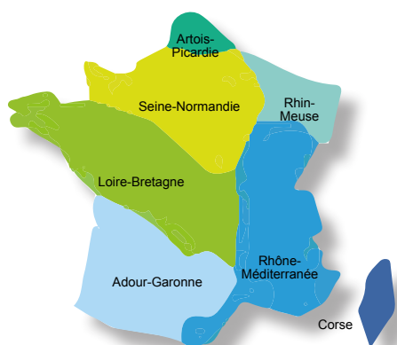
Les 7 bassins hydrographiques métropolitains

Pour reconquérir le bon état des eaux demandé par la directive cadre sur l'eau, les agences de l'eau recherchent la meilleure efficacité environnementale,