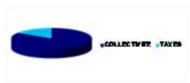
Répartition des montants collectés

Le prix du service comprend une partie fixe (abonnement) et un prix au m 3 consommé. Au total, un abonné domestique consommant 120 m 3 payera en 2017 entre 221,55 € et 249,40 € (sur la base du tarif du 1 er janvier 2017, toutes taxes comprises), avec une variation par rapport à 2016 comprise entre - 11,17 % et 0,00 % . Sur ce montant, 84 % reviennent à la collectivité pour les investissements et les taxes s'élèvent à 16 %.